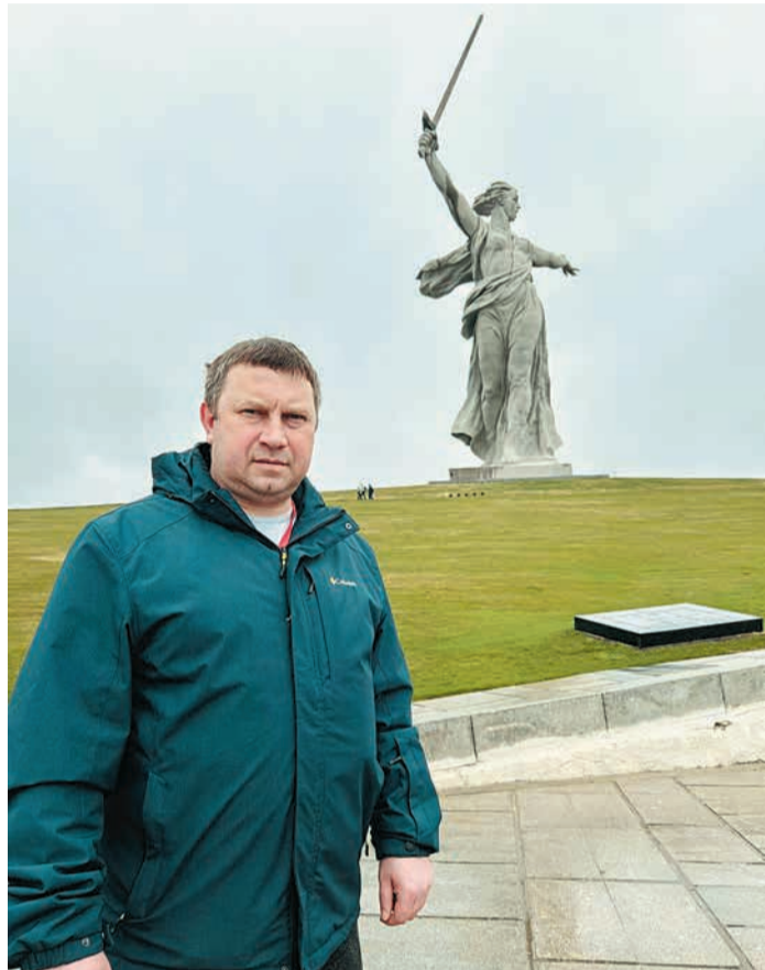
Мамаев курган, монумент «Родина-мать»

В этом году в конце марта совсем неожиданно мне поступило предложение попробовать себя в роли волонтера и совершить путешествие в город-герой Волгоград (с 1925 по 1961 год – Сталинград) в качестве сопровождающего группы нижегородских школьников. На сборы были сутки, и вот утром 1 апреля мы вышли на перроне города Волгограда. Нас встретила экскурсовод, которая проникновенно рассказывала об архитектуре города, его истории и битве за Сталинград.