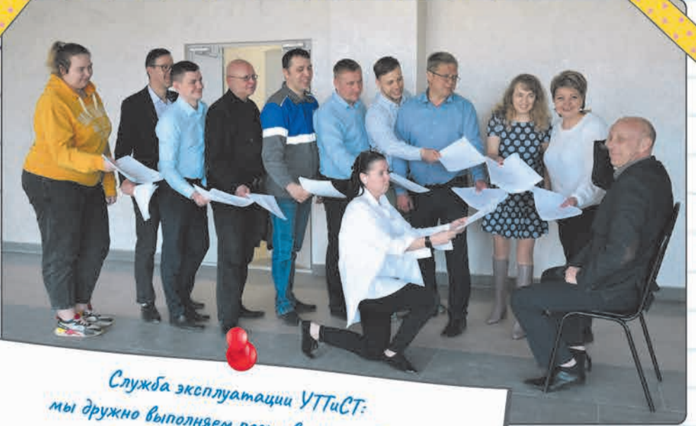
Служба эксплуатации УТТиСТ: мы дружно выполняем поставленные задачи и преодолеваем тяготы офисной службы, а каждый шаг превращаем в веселый забег к общему успеху.