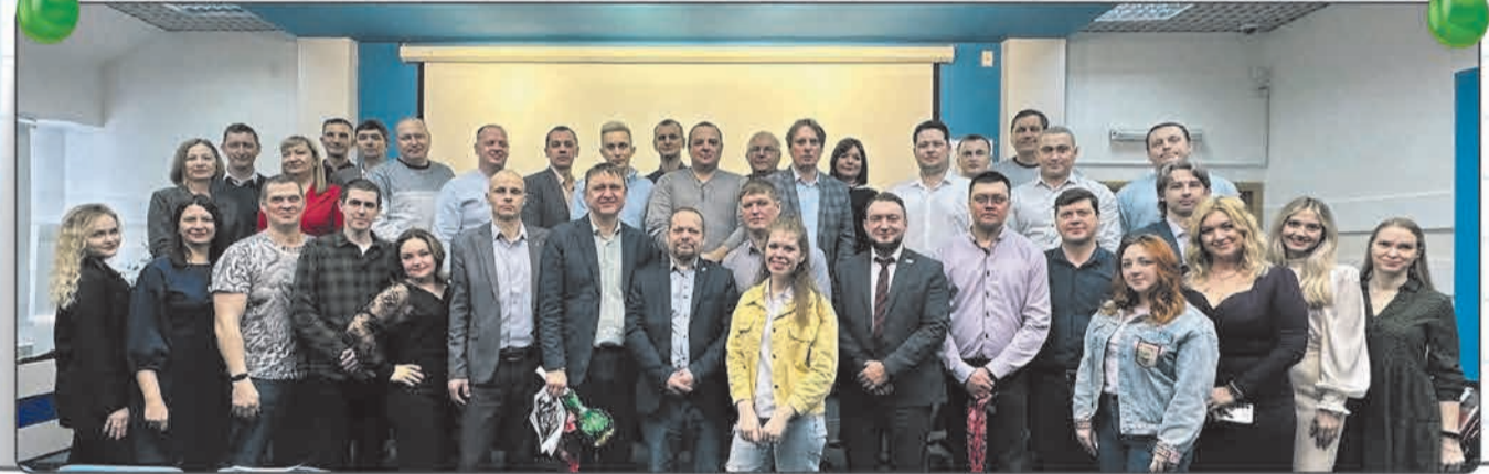
Коллектив Учебно-производственного центра: коллеги стали для нас настоящей трудовой семьей. Мы вместе учимся, развиваемся и достигаем новых вершин. А еще на работе мы нашли друзей и единомышленников!