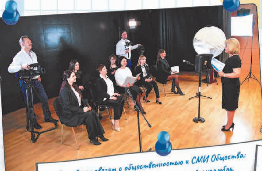
Служба по связям с общественностью и СМИ Общества: наш коллектив - похож на слаженный ансамбль, где каждый виртуозно владеет своим инструментом, будь то клавиатура, диктофон или камера. Так мы себя видим и чувствуем.