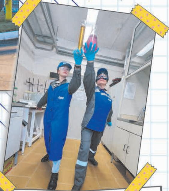
Работницы химико-аналитической лаборатории Кировского ЛПУМГ: работа - это не только профессиональное мастерство, но и совместное участие сотрудников подразделения в творческих и спортивных мероприятиях Общества.