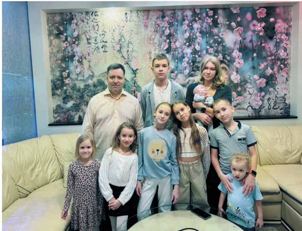
Счастье быть вместе