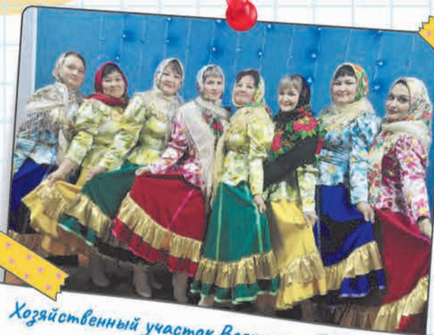
Хозяйственный участок Волжского ЛПУМГ: мы - команда, где все любят, ценят и уважают друг друга. Мы активно работаем и поддерживаем коллег в любых ситуациях.