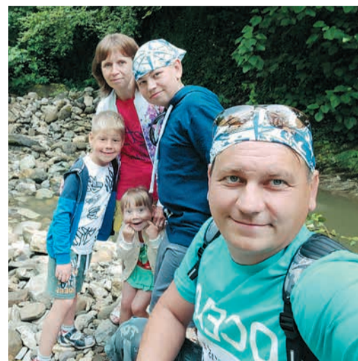
Время с семьей – бесценно

них вещей нигде не было – дети маленькие, им все интересно, и значит – надо попробовать на вкус. Но супруги не унывают и поддерживают друг друга.