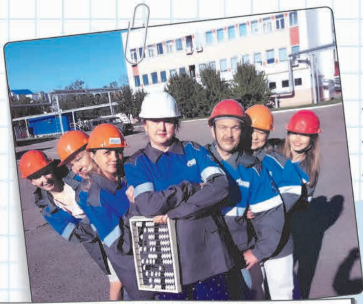
Учетно-контрольная группа Чебоксарского ЛПУМГ: мы проводим на работе значимую часть жизни, а желание общаться, дружить в коллективе вполне закономерно!