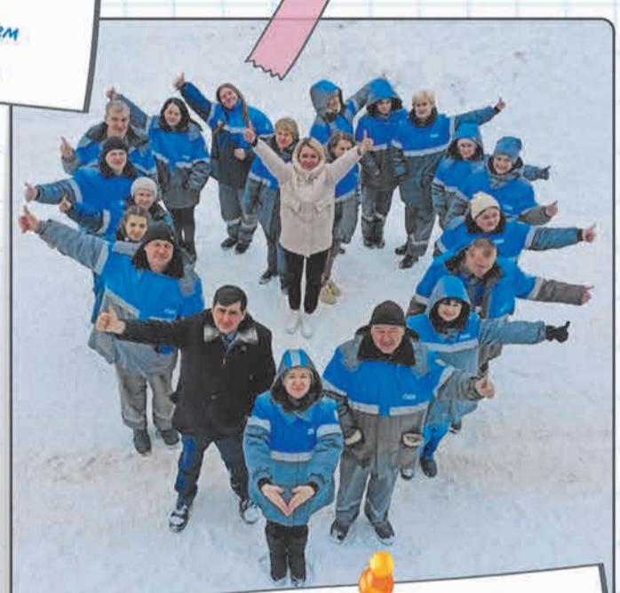
Коллектив базы хранения и реализации МТР «Доскино», УМТСиК: коллектив объединяет нас, здесь каждый знает свое дело и может подставить плечо коллегам!