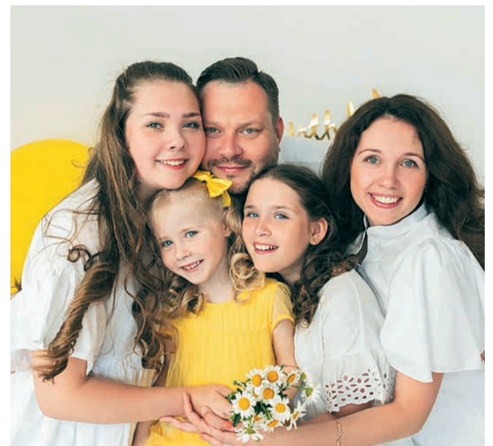
Красавицы-дочки – гордость родителей