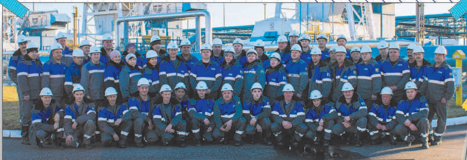
Газокompрессорная служба КС «Новоарзамасская», Арзамасского ЛПУМГ: мы вместе работаем, решаем проблемы, достигаем общих целей и радуемся успехам друг друга.