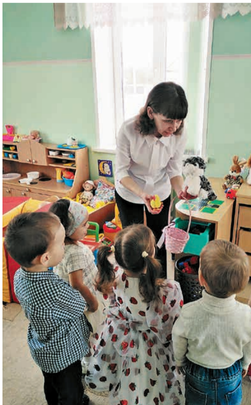
Ольга с воспитанниками

Конечно, у такого явления есть и свои минусы. Первый – в доме всегда многолюдно, поэтому всё и всегда нужно держать в чистоте и порядке, следить, чтобы никаких лиш-