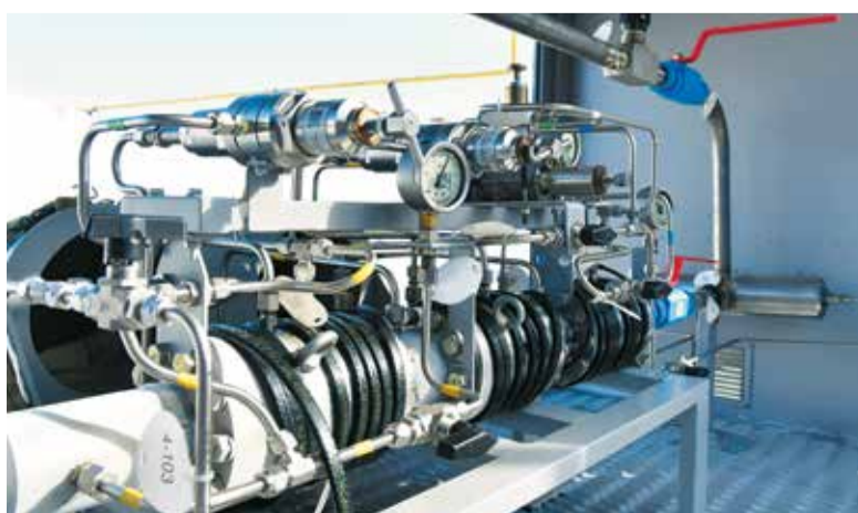
Модуль обеспечивает подачу газа от мобильного передвижного заправщика