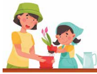
В РУБРИКЕ «ХОББИ» ПРОДОЛЖАЕМ РАССКАЗЫВАТЬ ОБ УВЛЕЧЕНИЯХ НАШИХ КОЛЛЕГ