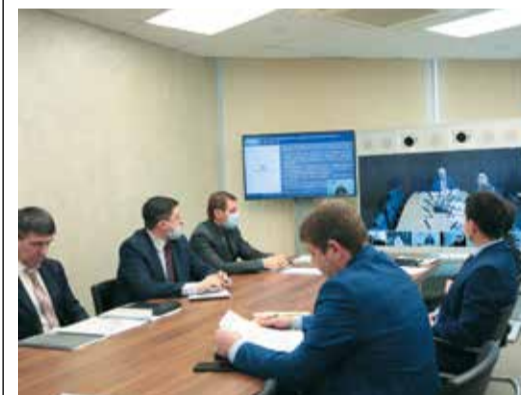
Руководители предприятия приняли участие в совещании по импортозамещению

Участники заседания обсудили реализацию мероприятий «дорожной карты» проекта «Расширение использования высокотехнологической продукции организаций Пензенской области, в том числе импортозамещающей, в интересах ПАО «Газпром».