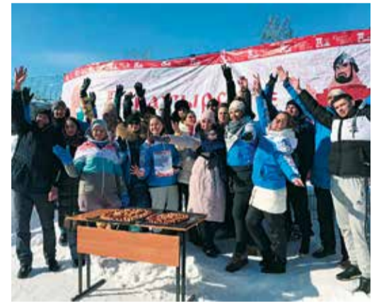
Дружно, молодо, задорно

На спортивном этапе мероприятия – эстафете – команды проходили полосу препятствий, соревновались в скорости, силе и ловкости.