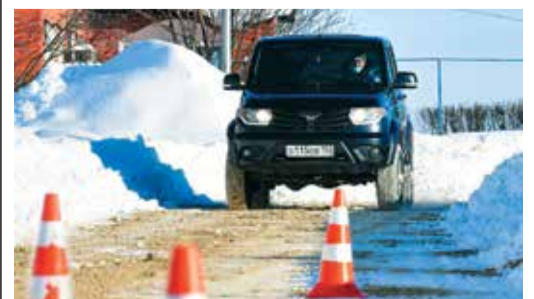
В УППЦ учат безопасному вождению

В 2021 году запланировано провести обучение 16 групп, десять из которых составят водители грузовых автомобилей и по три группы водителей, имеющих категории водительских прав В и D.