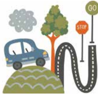
В УЧЕБНО-ПРОИЗВОДСТВЕННОМ ЦЕНТРЕ СТАРТОВАЛ НОВЫЙ ОБРАЗОВАТЕЛЬНЫЙ КУРС