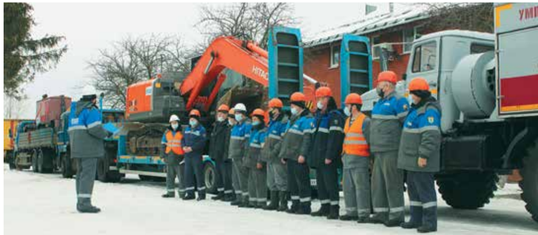
Комплексная противоаварийная тренировка в Ивановском ЛПУМГ

«Во всех филиалах нашего предприятия начались подготовительные мероприятия к пропуску большой воды, – говорит начальник производственного отдела по эксплуата-