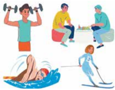
СОСТОЯЛАСЬ ЗИМНЯЯ СПАРТАКИАДА ОБЩЕСТВА