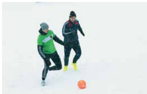
Игра проходила в непростых погодных условиях