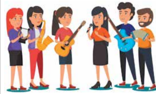
ОБЗОР СПОРТИВНЫХ И ТВОРЧЕСКИХ СОБЫТИЙ, В КОТОРЫХ ПРИНИМАЛИ УЧАСТИЕ СОТРУДНИКИ ПРЕДПРИЯТИЯ