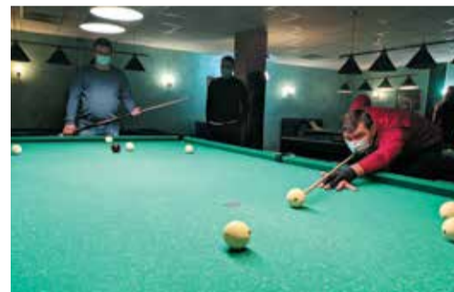
Крепкая рука и железная выдержка – залог победы