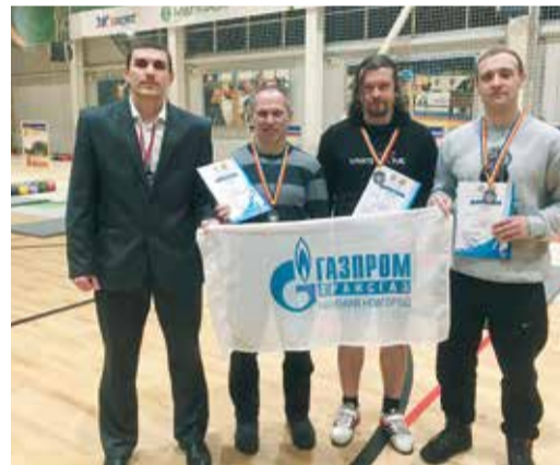
Участники турнира по гиревому спорту

Атлеты соревновались в двоеборье – толчок двух гирь по короткому циклу и рывок одной гири, в длинном цикле – толчок двух гирь и короткий спуск гирь вниз без постановки на помост, а также в «армейских играх» – толчок одной гири по длинному циклу с одним перехватом.