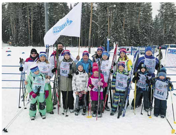
Команда Кировского ЛПУМГ