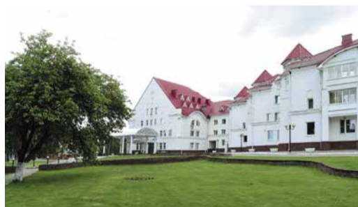
База отдыха «Волга»

По итогам 2018 года более 2200 работников предприятия и членов их семей прошли реабилитационно-восстановительное лечение в санаториях нашей страны: в Поволжье, на юге, Северном Кавказе и Крымском полуострове, в том числе в здравницах ООО «Газпром трансгаз Нижний Новгород».