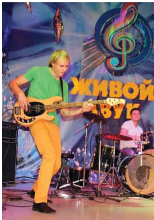
Трио «JAW» из Арзамасского ЛПУМГ

— По количеству одаренных ярких артистичных сотрудников наше предприятие достойно конкурирует со всеми дочерними предприятиями «Газпрома». И прошедший в этом году фестиваль самодеятельного творчества газовиков это подтвердил. У нас замечательные работники, крепкие коллективы, у нас самые лучшие творческие силы! Люди увлеченные, они не только работают с полной отдачей, но и творят с душой, с полным самозабвением. Мы верим, что творчество на нашем предприятии будет развиваться еще многие годы, и будем прикладывать для этого все возможные усилия. ■