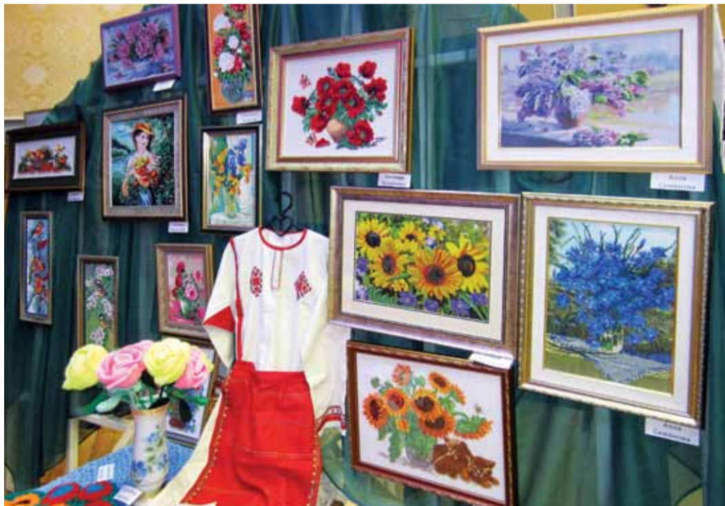
Наших детей воспитывают талантливые люди (выставка детского сада)