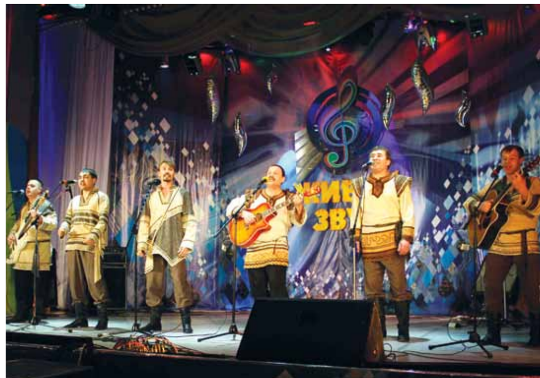
Гран-при фестиваля завоевал вокальный эстрадный ансамбль «Кумовья»