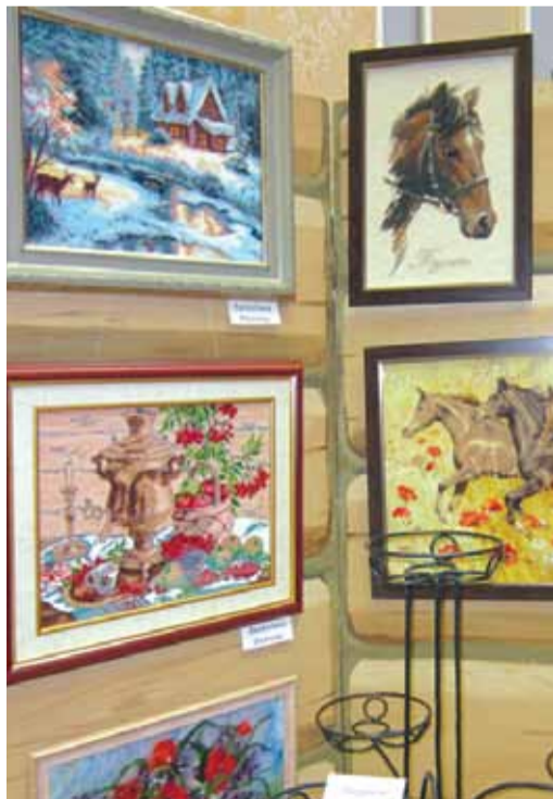
...А это теплый уголок бывших сотрудников филиала