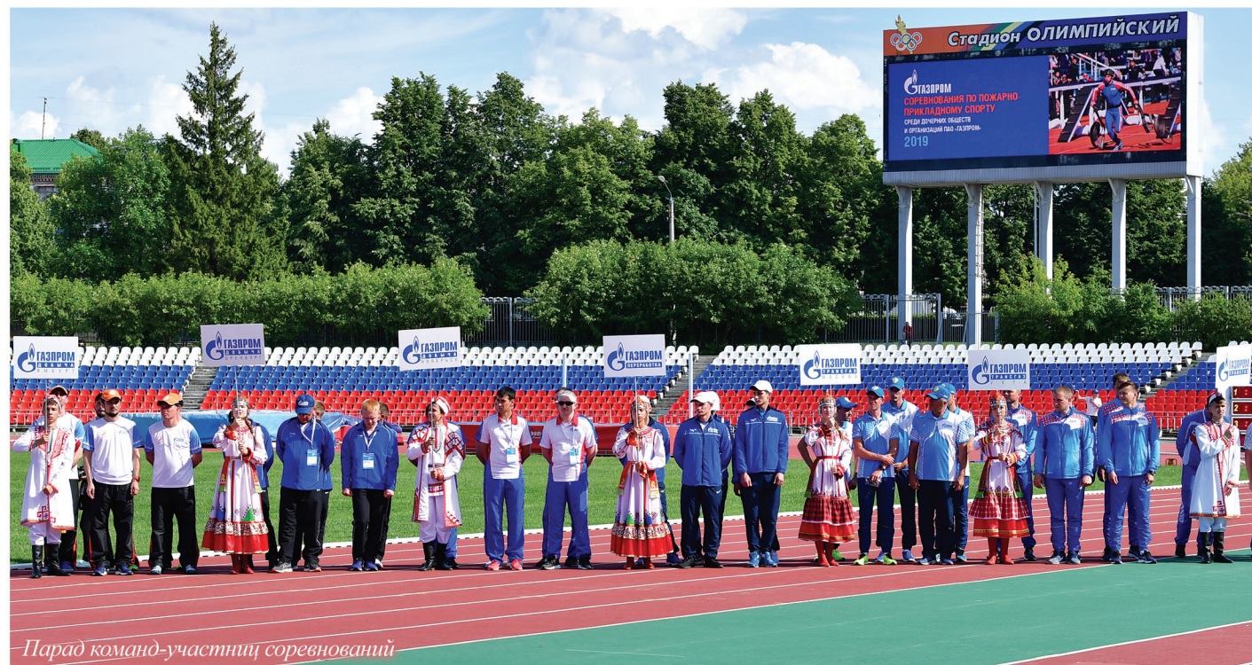
Парад команд-участниц соревнований

Много раз участвовал в ликвидации аварий и точно знаю, насколько важны выносливость, физическая сила, быстрое реагирование и психологическая подготовка спасателей. На соревнованиях по пожарно-прикладному спорту спасатели демонстрируют возможности, которые они применяют при ликвидации чрезвычайных ситуаций. По результатам этих соревнований появятся новые чемпионы. Желаю удачи и честной борьбы!