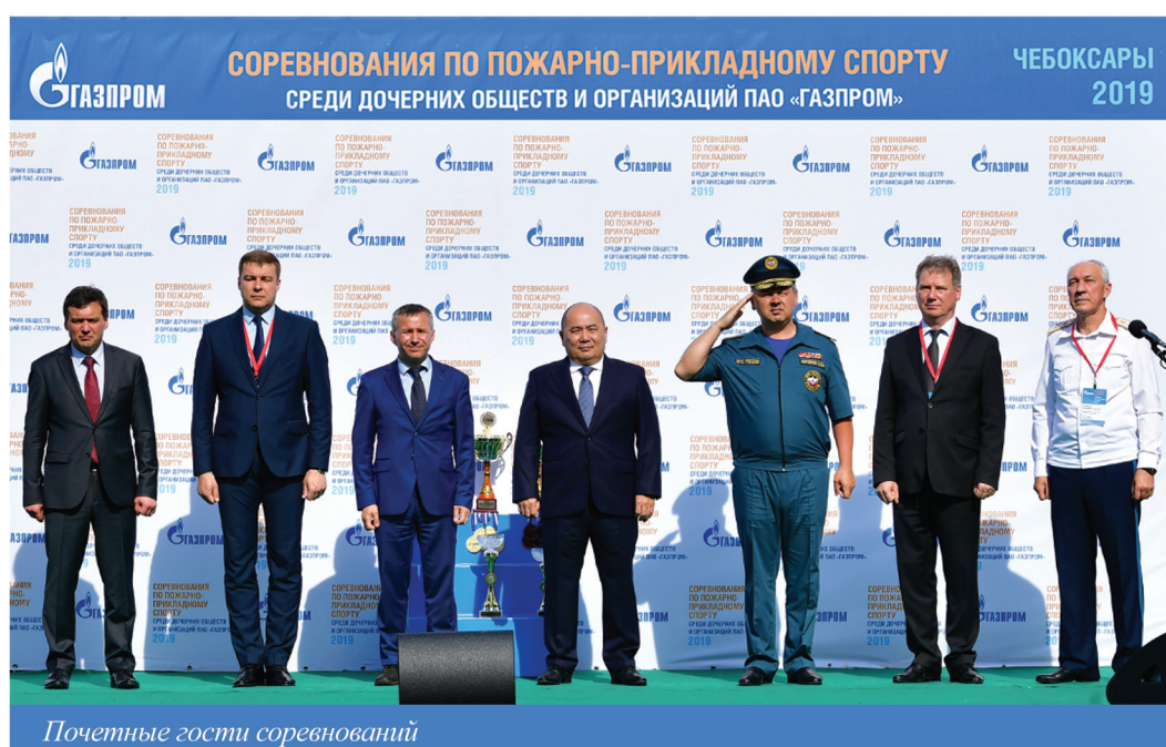
Почетные гости соревнований

Каждый участник стремится к чемпионству в личном зачете. Но важно, что у нас соревнуются команды – дочерние общества и организации ПАО «Газпром». Мы видим у всех спортсменов желание добиться хорошего результата для своей сборной. Победа на таких соревнованиях – это почетно для предприятия.