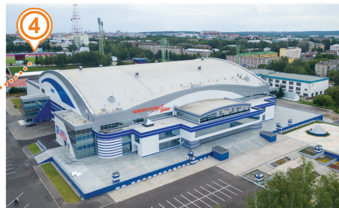
ЛЕДОВЫЙ ДВОРЕЦ «ЧЕБОКСАРЫ АРЕНА» (Заккрытие соревнований)