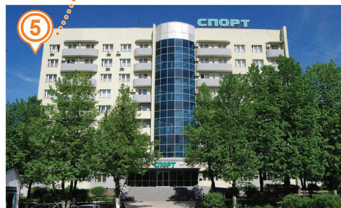
ГОСТИНИЦА «СПОРТ» (Проживание участников соревнований)