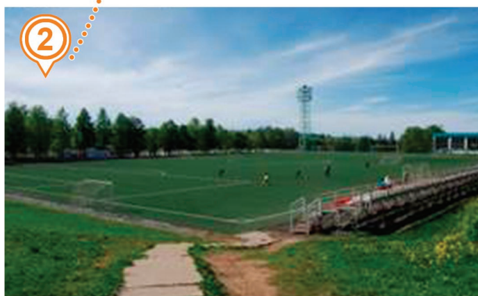
ФУТБОЛЬНОЕ ПОЛЕ (Дисциплина: боевое развертывание)