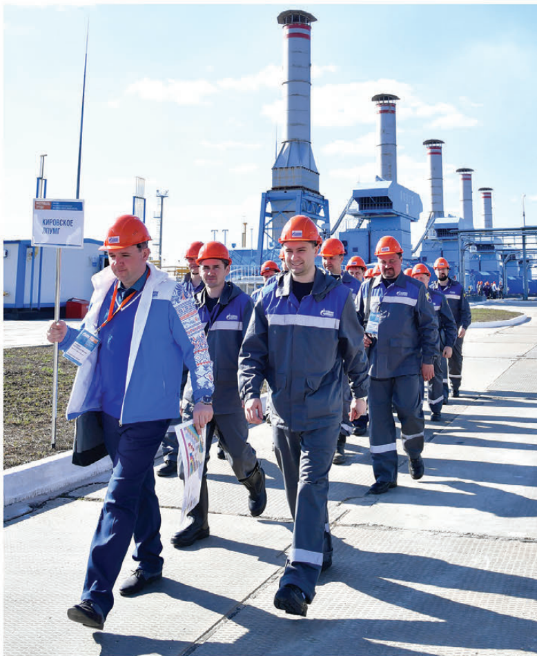
Команда Кировского ЛПУМГ направляется на место проведения квеста