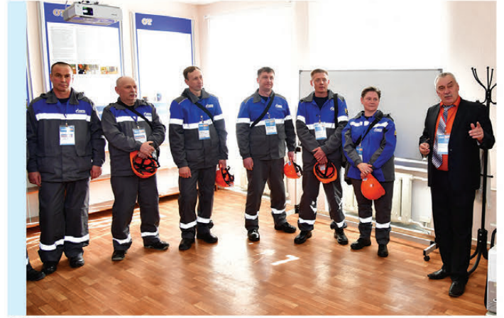
Информирование о происшествиях