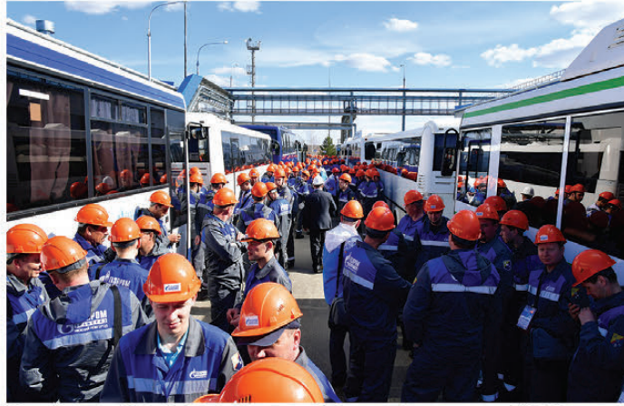
Станция «Лукояновская», следующая станция «УПЦ»