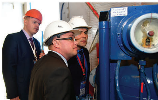
Практическая часть аттестации

У главных инженеров и их заместителей по охране труда, промышленной и пожарной безопасности, в сравнении с рабочими, гораздо больше опыта в поиске нарушений на производственных объектах, поэтому и требования к ним строже.