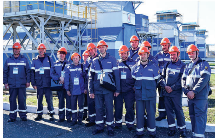
Команда Вятского ЛПУМГ