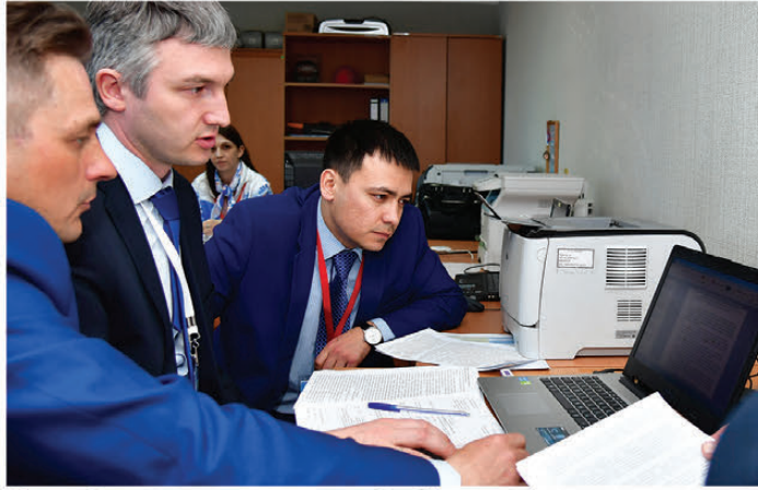
Разработка эталонного наряда-допуска