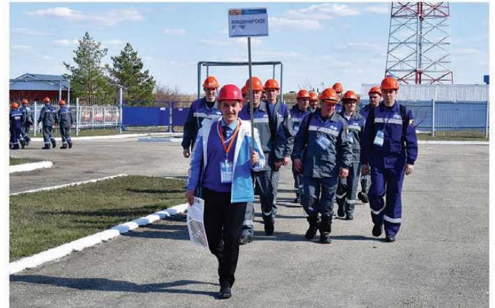
Команда Владимирского ЛПУМГ