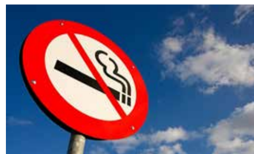
«ЗНАЕМ, КАК ПОМОЧЬ ВАМ ИЗМЕНИТЬ СВОЮ ЖИЗНЬ К ЛУЧШЕМУ» 16 ноября – День отказа от курения. стр. 4