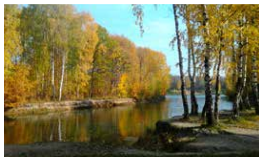
БОГАТСТВО И РАЗНООБРАЗИЕ ПРИРОДЫ РЕГИОНОВ ДЕЯТЕЛЬНОСТИ ПРЕДПРИЯТИЯ Год экологии в ПАО «Газпром». стр. 2