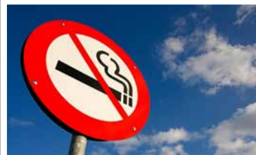
«ЗНАЕМ, КАК ПОМОЧЬ ВАМ ИЗМЕНИТЬ СВОЮ ЖИЗНЬ К ЛУЧШЕМУ» 16 ноября – День отказа от курения. стр. 4