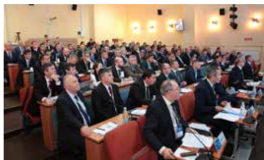
«НАША ЦЕЛЬ – НАУЧИТЬ МЫСЛИТЬ СИСТЕМНО» Осеннее заседание Совещания по надежности. стр. 2