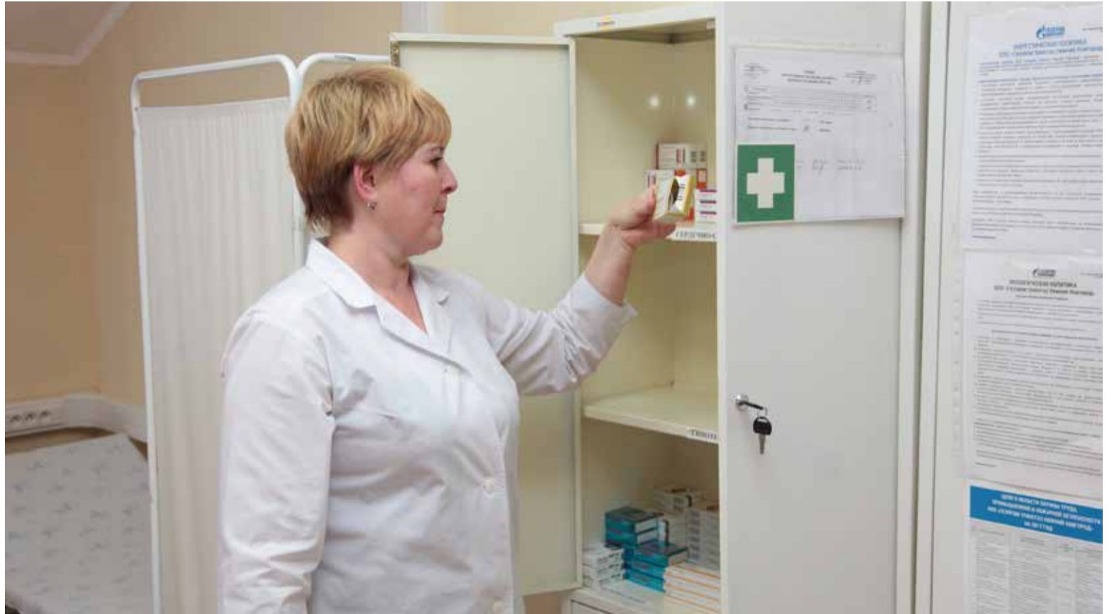
В здравпунктах Общества вам всегда готовы оказать помощь

Для большинства курильщиков отказ от курения – это самое главное и часто единственное, что они могут сделать для улучшения своего здоровья и здоровья окружающих. В успехе отказа от курения главную роль играют мотивация и решимость. Медицинская помощь может удвоить ваши шансы на успех. Существует две основные группы лекарственных препаратов для лечения та-