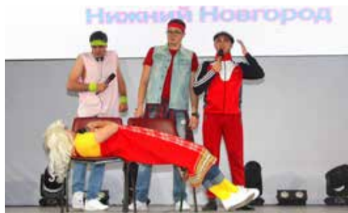
«МЫ ТОЧНО ЗНАЕМ: КВН – ЭТО БОЛЬШАЯ СЕМЬЯ» Конкурс веселых и находчивых. стр. 3